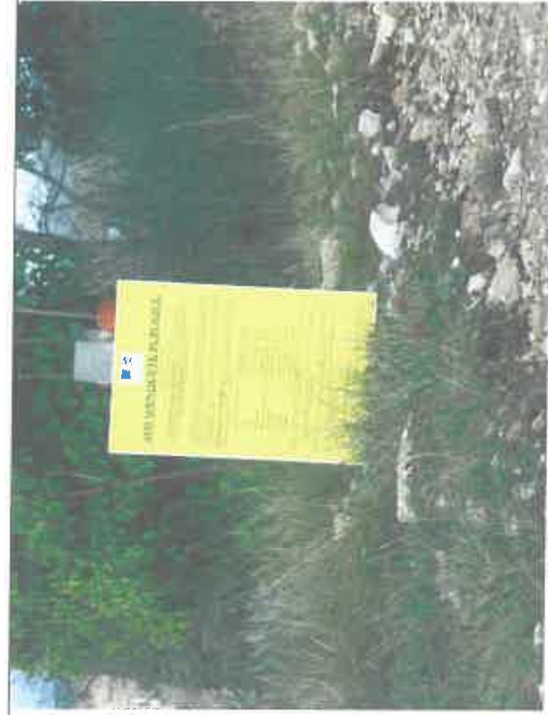
Affichage de l'avis d'enquête sur les pistes

Les travaux de réfection et d'entretien des pistes se feront sur une périodicité allant de 5 à 15 ans ; les travaux de débroussaillage se feront tous les 4 ans.