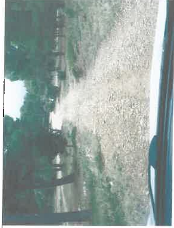
Vue d'une des pistes : VX 101