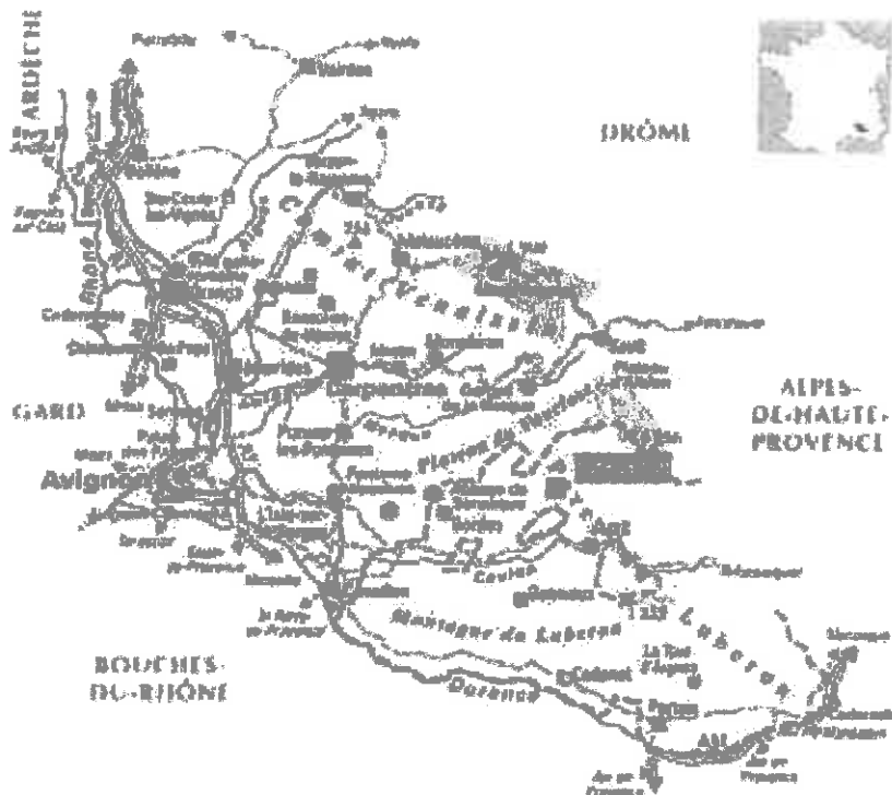
Illustration 1: carte de localisation (source dossier)

1 kilo Watt crête (puissance maximale que la centrale peut délivrer)