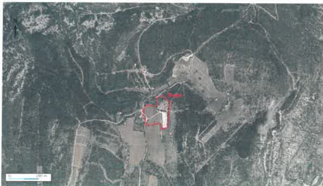
Figure 2 : localisation du projet

Le terrain concerné par le projet est composé d'une partie est, occupée par les différents bâtiments de l'activité d'élevage et une partie ouest, consacrée aux terres cultivées (lavandin) et à un chemin en terre battue permettant l'accès à l'élevage.