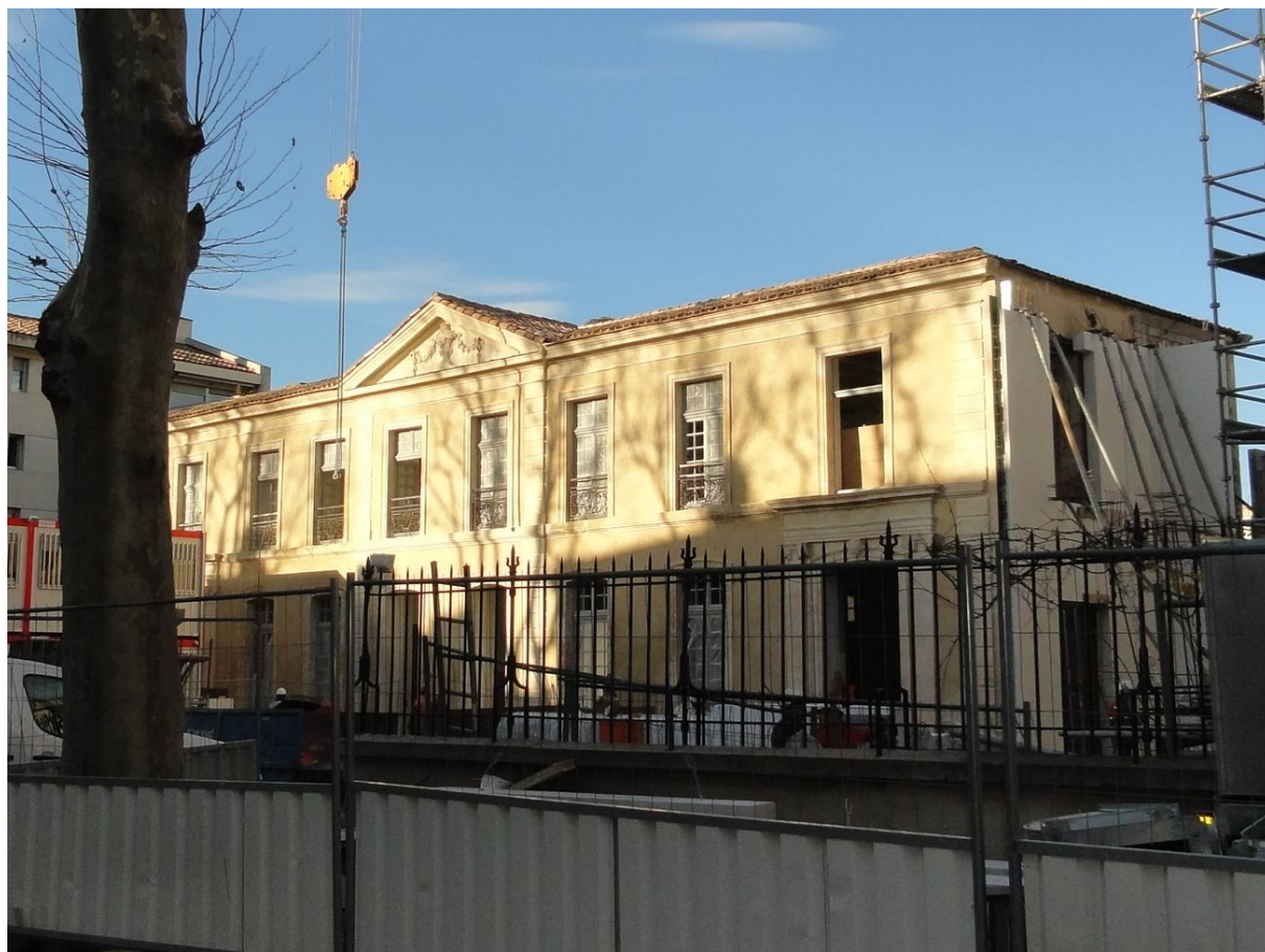
L'Hôtel de Montfaucon en travaux